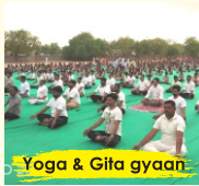
Yoga & Gita gyaan