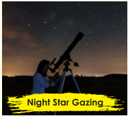
Night Star Gazing