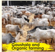
Gaushala and Organic farming